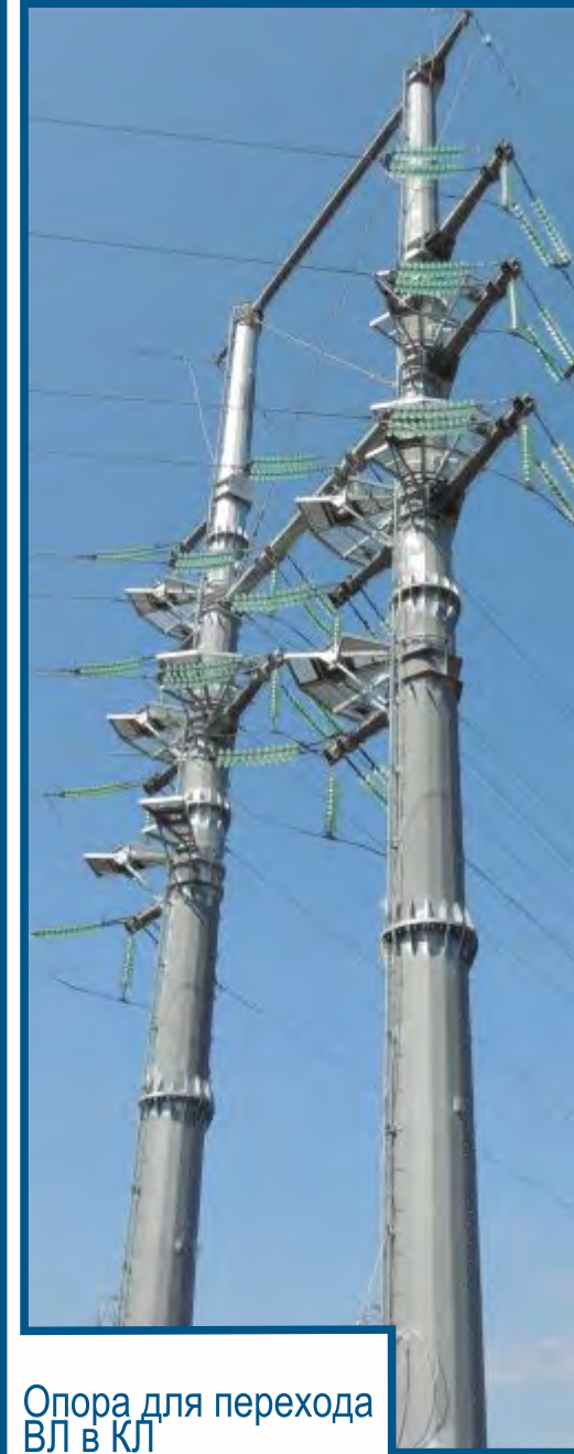
Опора для перехода ВЛ в КЛ