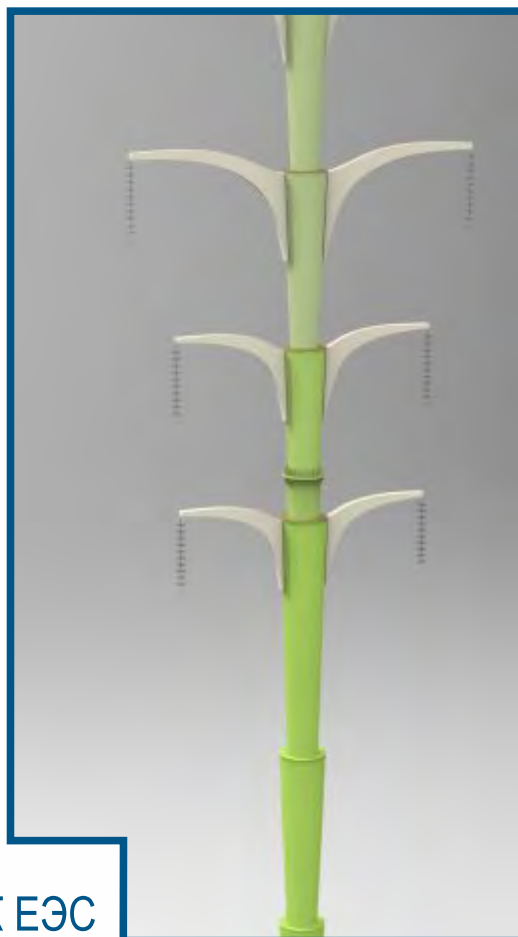
Проекты эстетических опор, НИОКР по заказу ПАО «ФСК ЕЭС»