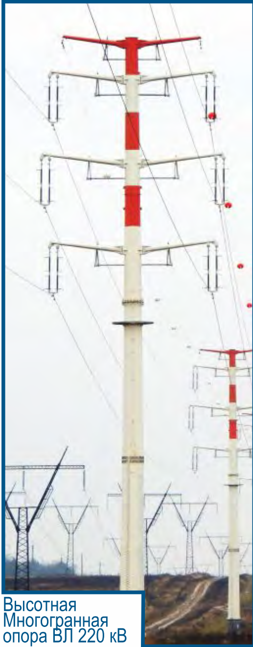
Высотная Многогранная опора ВЛ 220 кВ