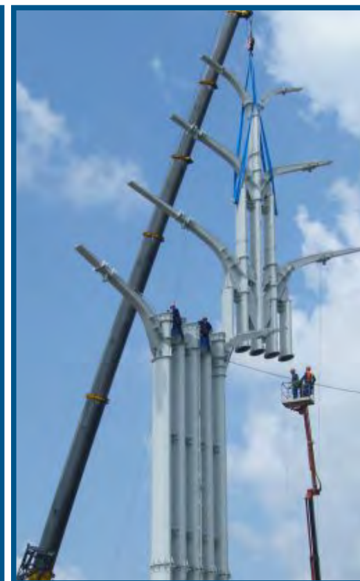
Монтаж эстетических опор в районе пересечения МКАД и Калужского шоссе