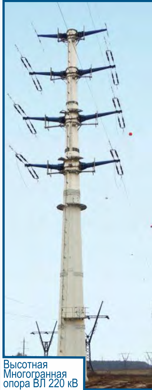
Высотная Многогранная опора ВЛ 220 кВ